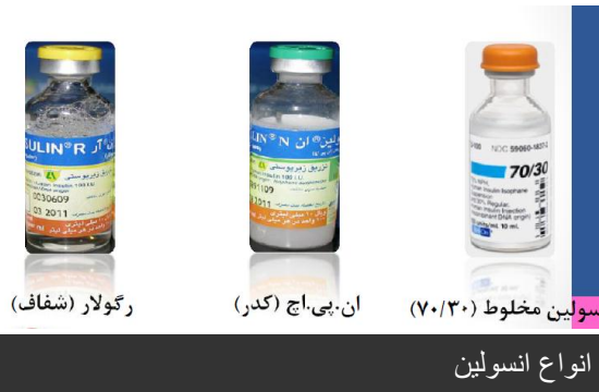
انوسولین مخلوط (۷۰/۳۰) ان.پی.اچ (کدر) رگولار (شفاف)